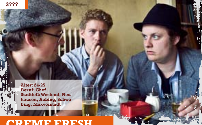
Alter: 24-25 Beruf: Chef Stadtteil: Westend, Neuhausen, Aubing, Schwabing, Maxvorstadt